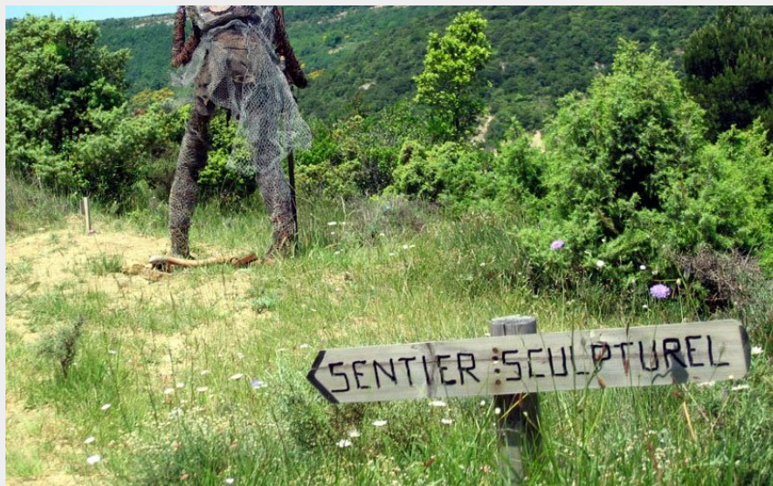
Old man Traveler - ARTISTE Joe big big