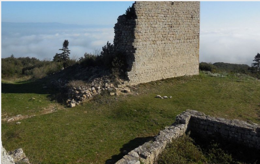
Ruines de Miramont