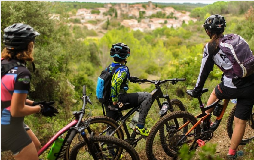
Vue sur le village d'Aragon