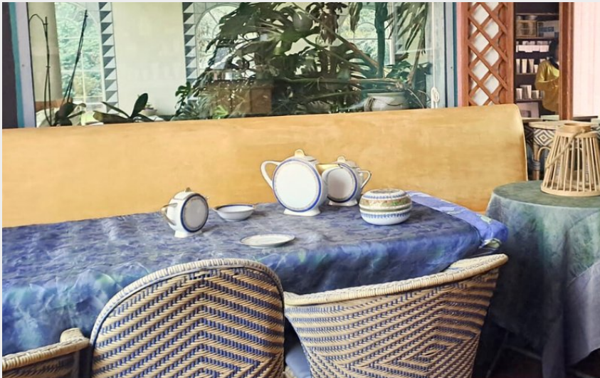
Crédit photo : Demeure Bergamote - Salon intérieur - Myriam DEREIX (Myriam DEREIX)