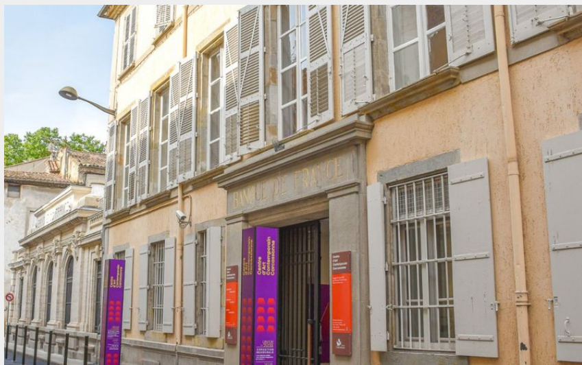
Crédit photo : centre d'art contemporain - 1 (Tourisme Carcassonne)