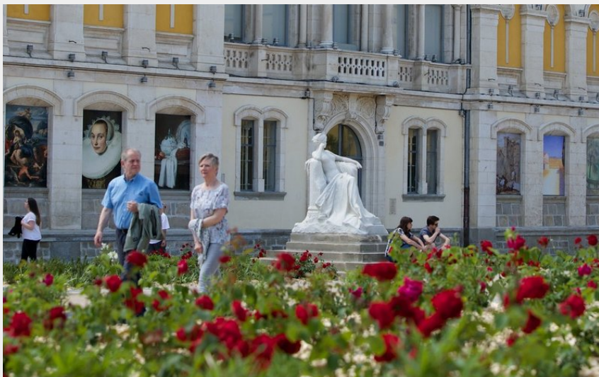
Crédit photo : 2015_GAMBETTA_IMG_0300 facade fleurs (©Ville de Carcassonne)