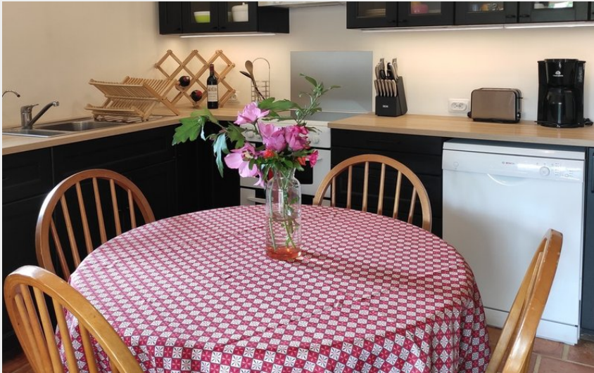
Attribution : DOMAINE D AZEOU Cuisine