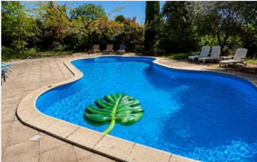
Attribution : CAMMAZOU BAS PISCINE