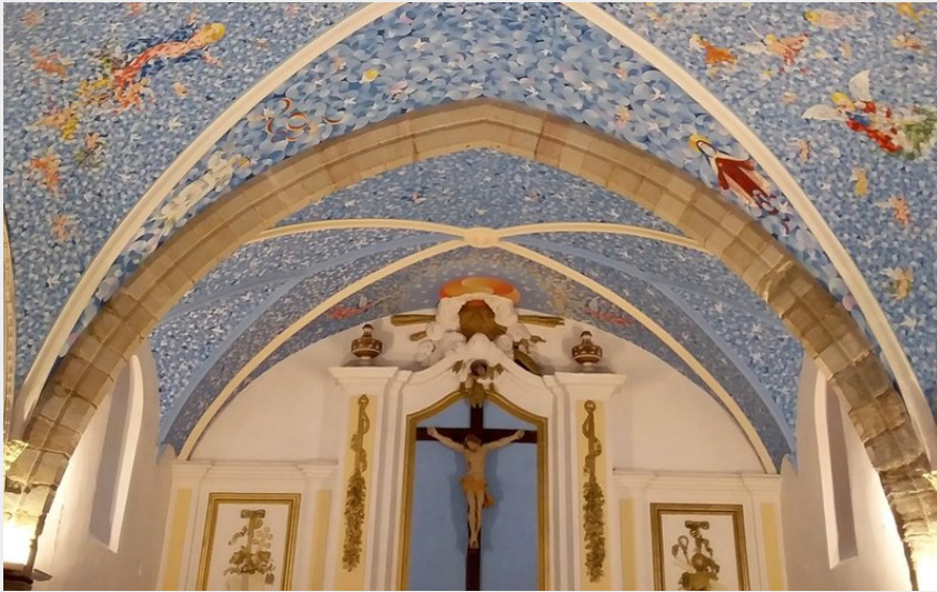
Attribution : journees-patrimoine-harillo--eglise-raissac-sur-lampy