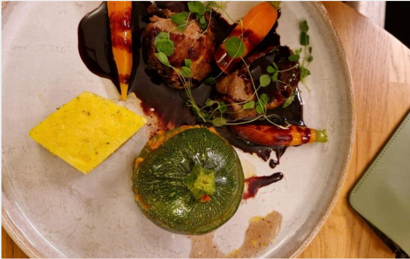
Attribution : atelier des saveurs - 1