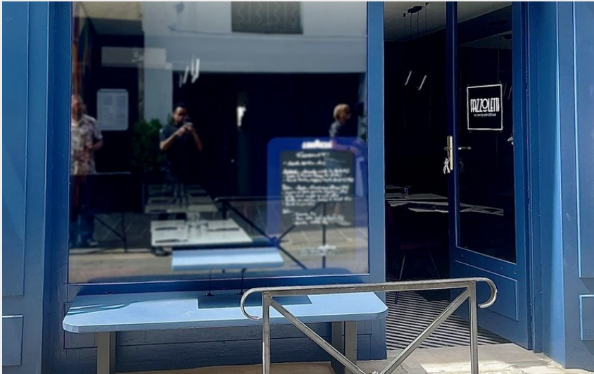
Attribution : FAZZOLETTI (1)