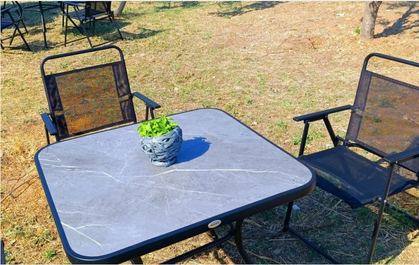
Attribution : BOULANGERIE SEVERAC 2 B