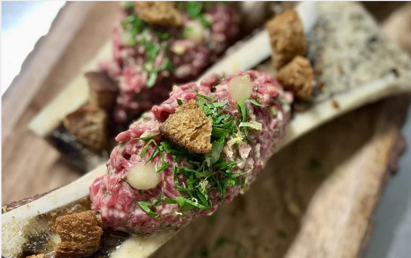
Attribution : CANAILLE TAPAS