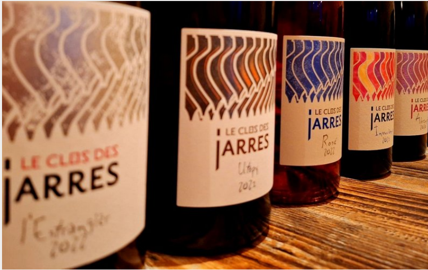
Attribution : CLOS JARRES A