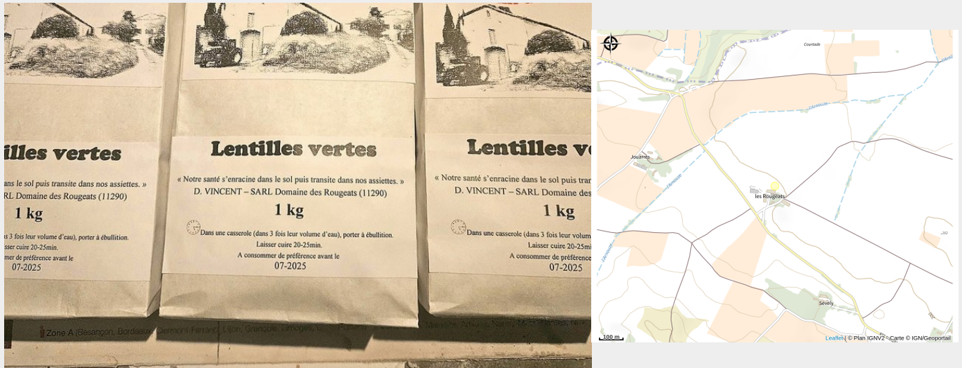
Attribution : LE MOULIN DE ROUGEATS (1)