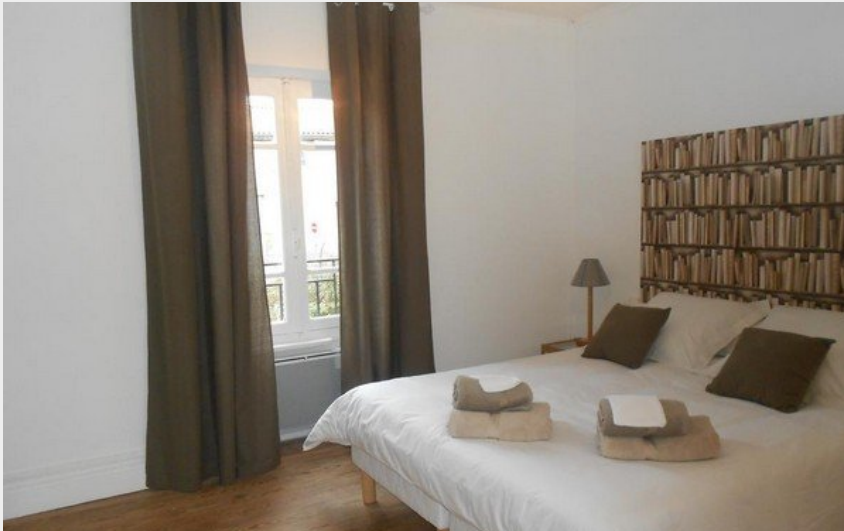
Attribution : PITCHPIN CHABRE 1