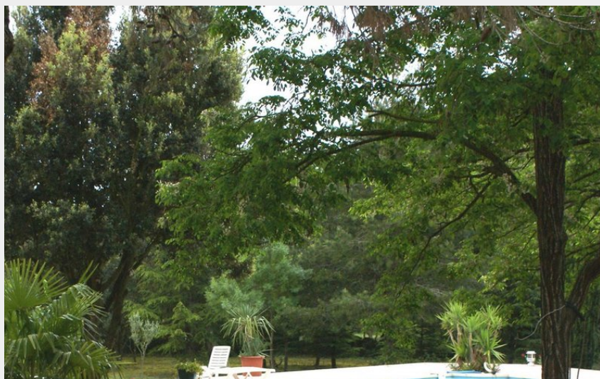
Attribution : CASOT PISCINE