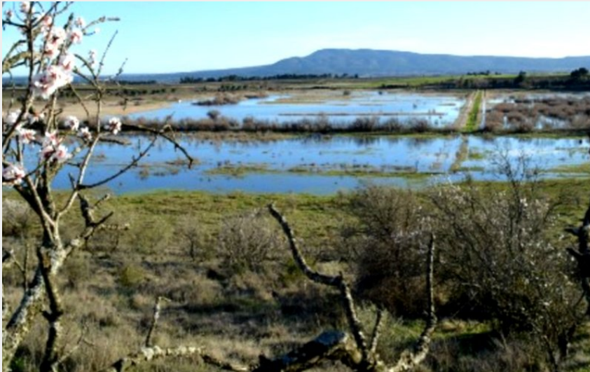
Attribution : SENTIER ESTAGNOL ETANG