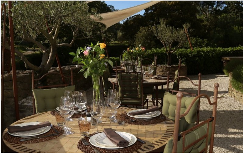
Attribution : Resto Château Villarlong Villarzel 2