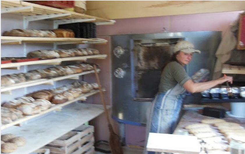
Attribution : MAYRONNES LE PAIN DE CHLOE A