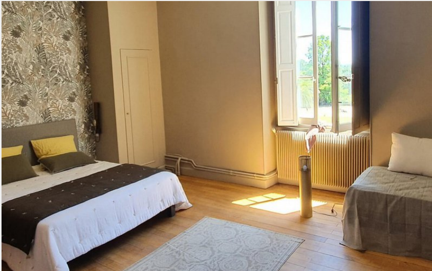
Attribution : ANGE AU VIOLON CHBRE