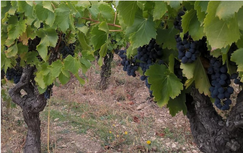
Attribution : CIRY