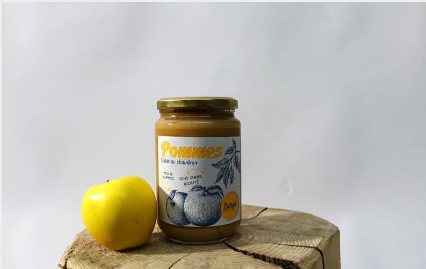
Attribution : BERGÉ ADRIEN