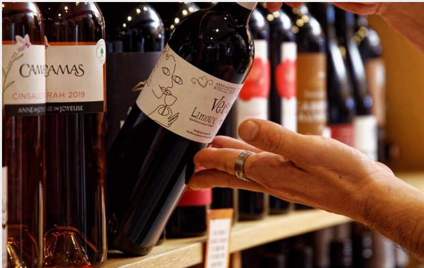
Attribution : LE VERRE D'UN bouteille best