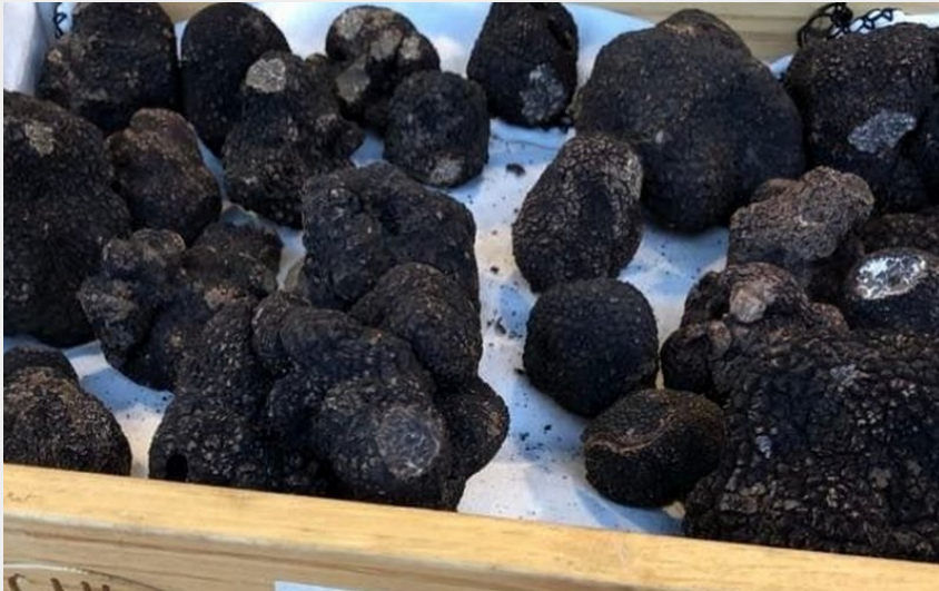
Attribution : Truffe pays cathare