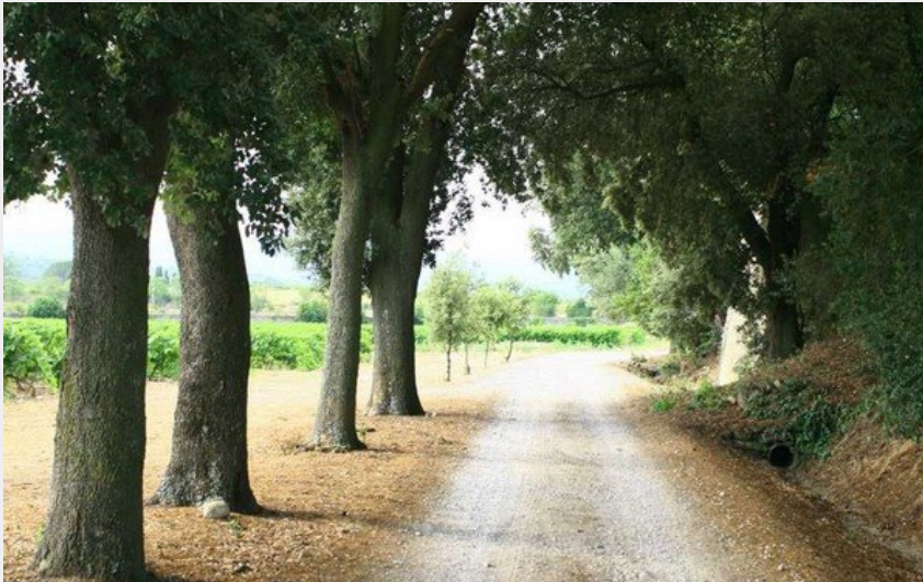
Attribution : ALLEE CH FONTIES