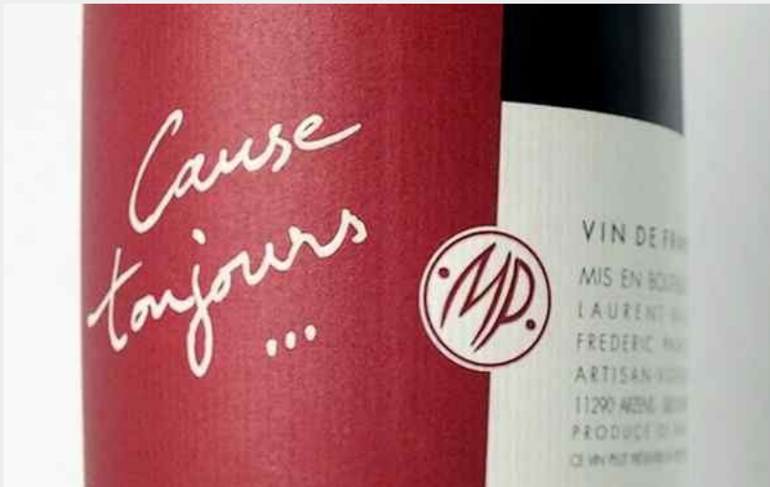
Attribution : LE MAS DE MON PERE VIN ARZENS 2