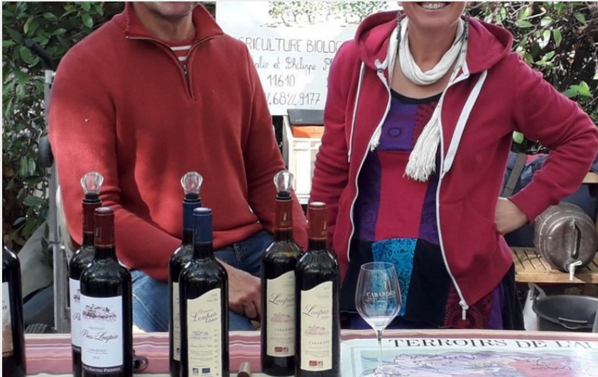
Attribution : DOMAINE LOUPIA 2019