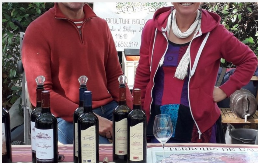
Attribution : DOMAINE LOUPIA 2019