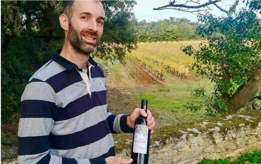
Attribution : DOMAINE SESQUIERE LAGOUTTE