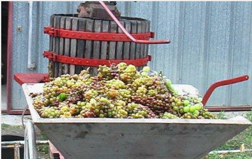
Attribution : DOMAINE LA PARRA (1)