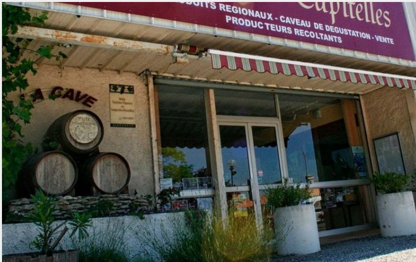
Attribution : CELLIER DES CAPITELLES