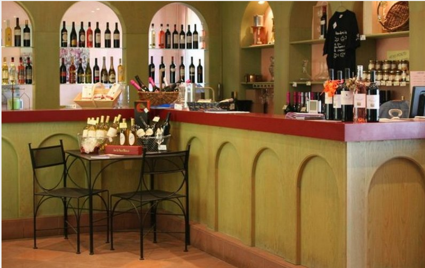
Attribution : CELLIER DE MERINVILLE