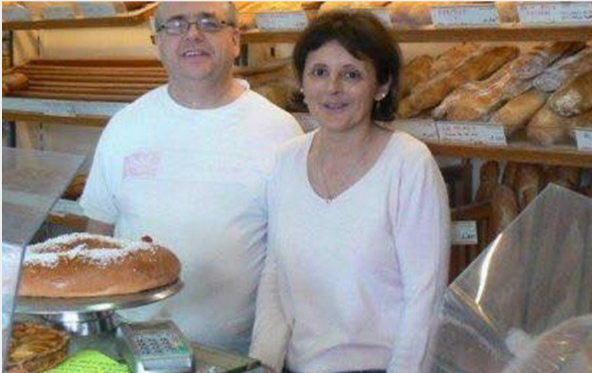
Attribution : BOULANGERIE FABRE ALZONNE 2