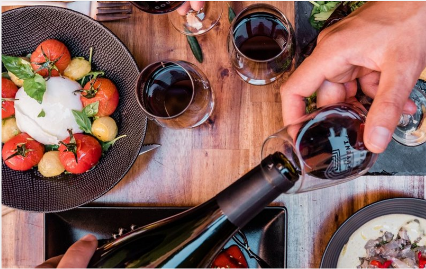
Attribution : DSC_6123 (Ludo Charles)