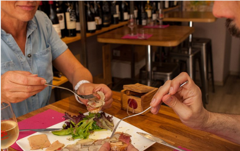
Attribution : BARRRIERE TRUFFES (Philippe Benoist - ADT de l'Aude)