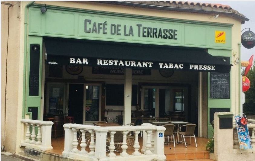
Attribution : Café La Terrasse Marseillette