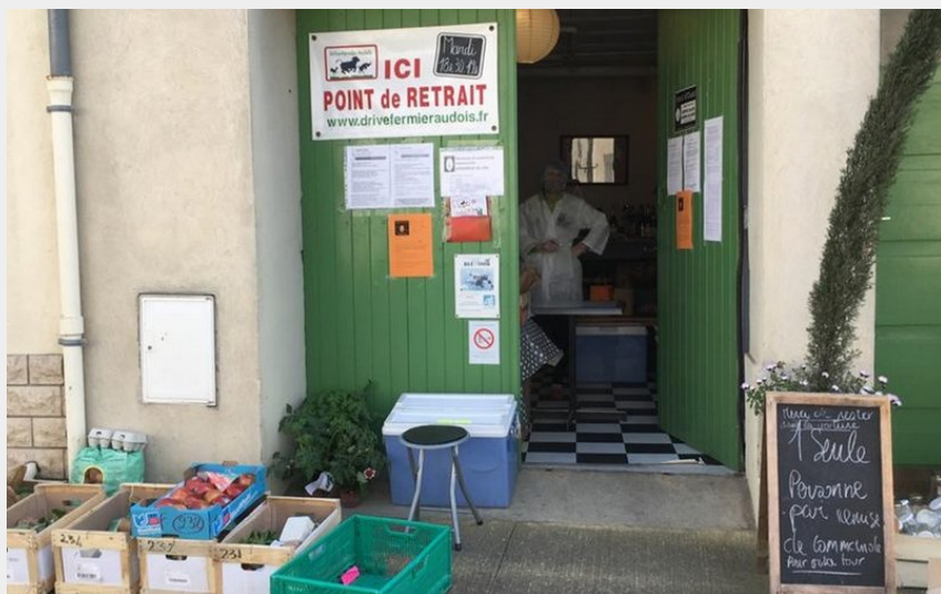
Attribution : Creperie vent d'ouest