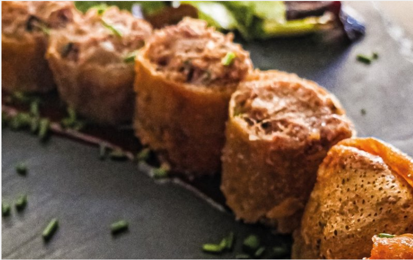
Attribution : LA CANTINE DU SAINT ROCH-1