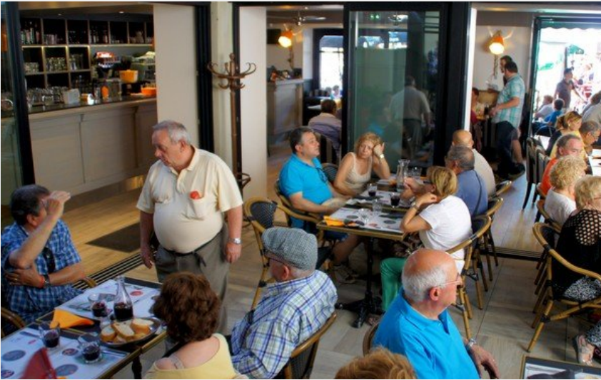
Attribution : Le menestrel-1.jpg