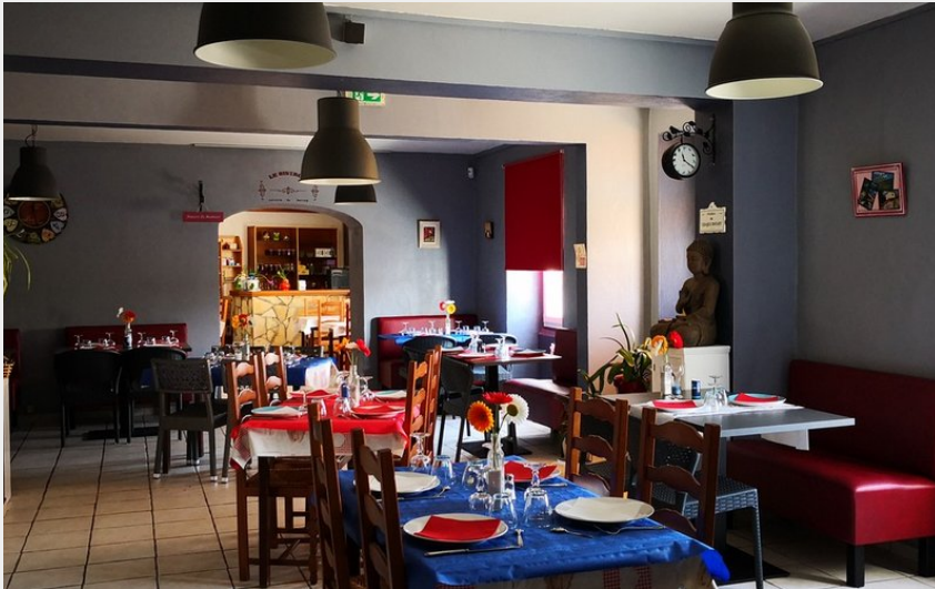
Attribution : O-FIL-DE-I-O-AUBERGE (Le Page)