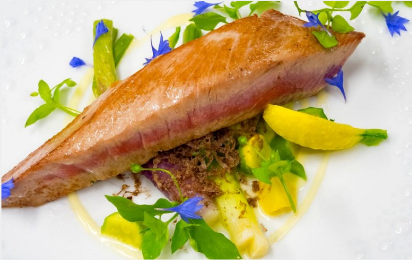
Attribution : LE PUIITS DU TRÉSOR-2 (Le Puits du Trésor)