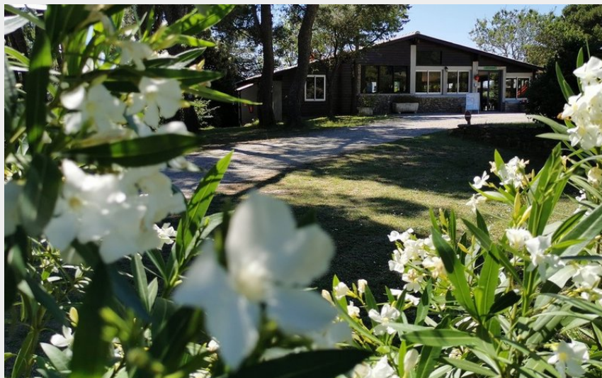
accueil vue des lauriers