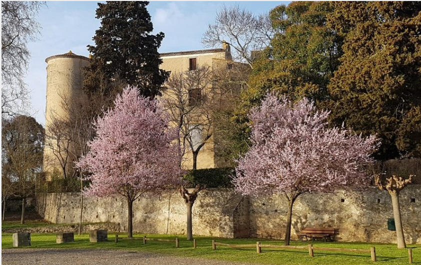
Attribution : PARKING LEUC 1 (E. Pages)