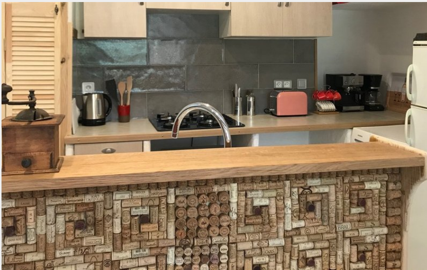
Attribution : GARGOUILLE CUISINE