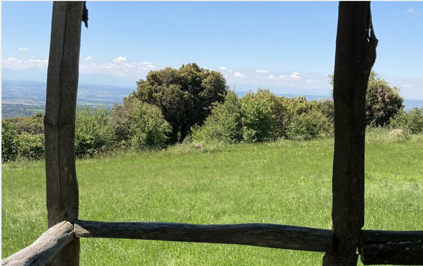
Attribution : CABANE (2)