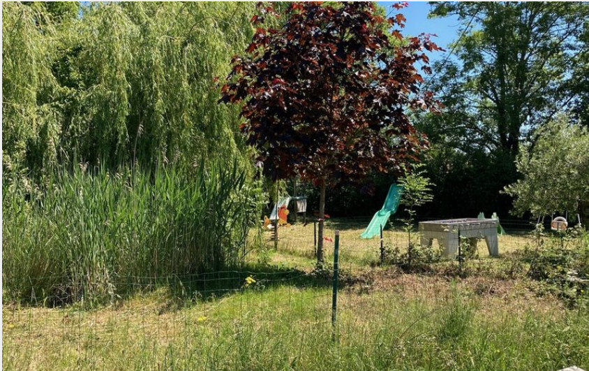
Attribution : AIRE DE JEUX