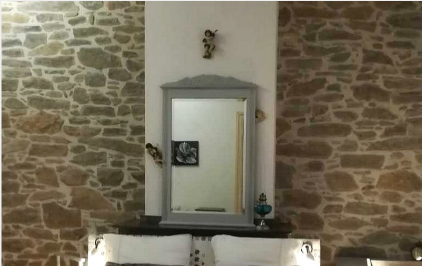
Attribution : BELLE MINERVOISE CHBRE A