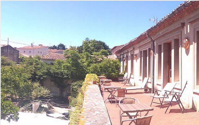
Attribution : Ch hote Montolieu L'Apostrophe 3