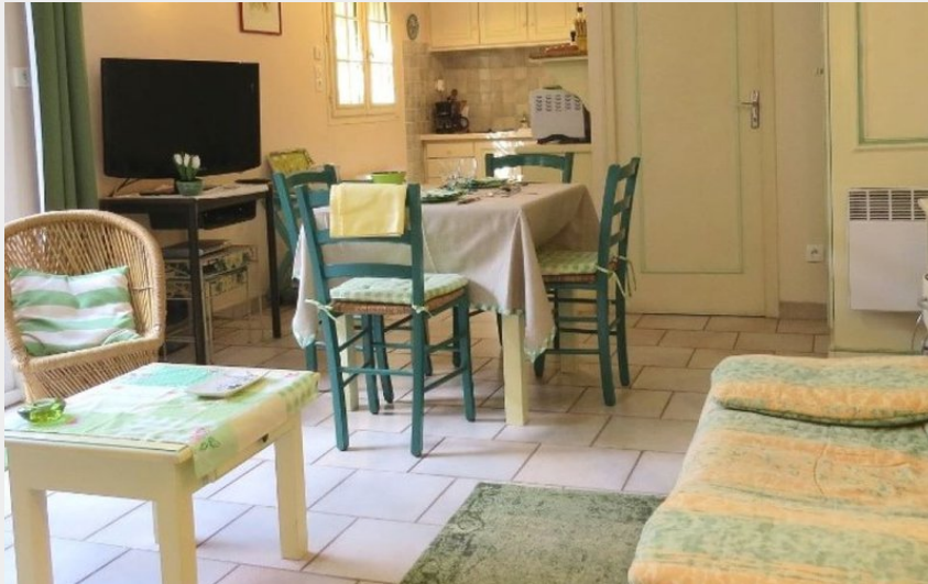
Attribution : 10 salon