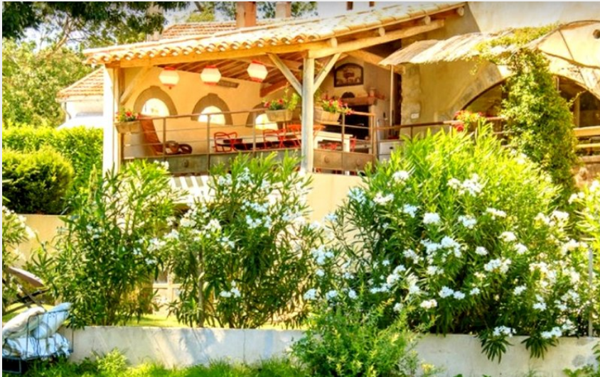
Attribution : AU FIL DE L'EAU